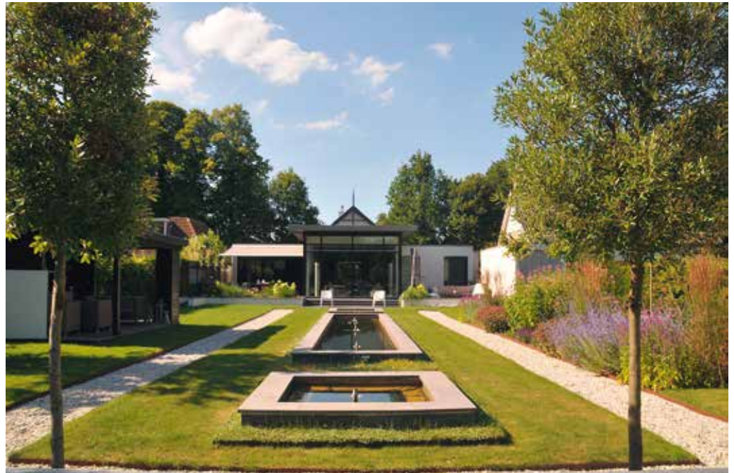
'In deze tuin kan je door het voorraam, via de bal, geheel naar achteren kijken: een lange rechte zichtlijn die dwars door huis en tuin snijdt. Het zicht eindigt op een blikvanger, in dit geval een grote witte plantenbak.'