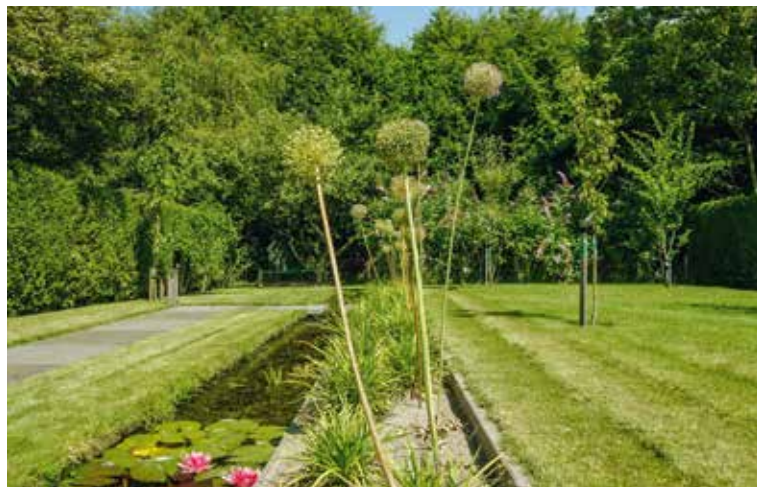
'Drie tuinkamers, verbonden door een vijver van 25 meter lang. Aan het einde een doorkijk.'