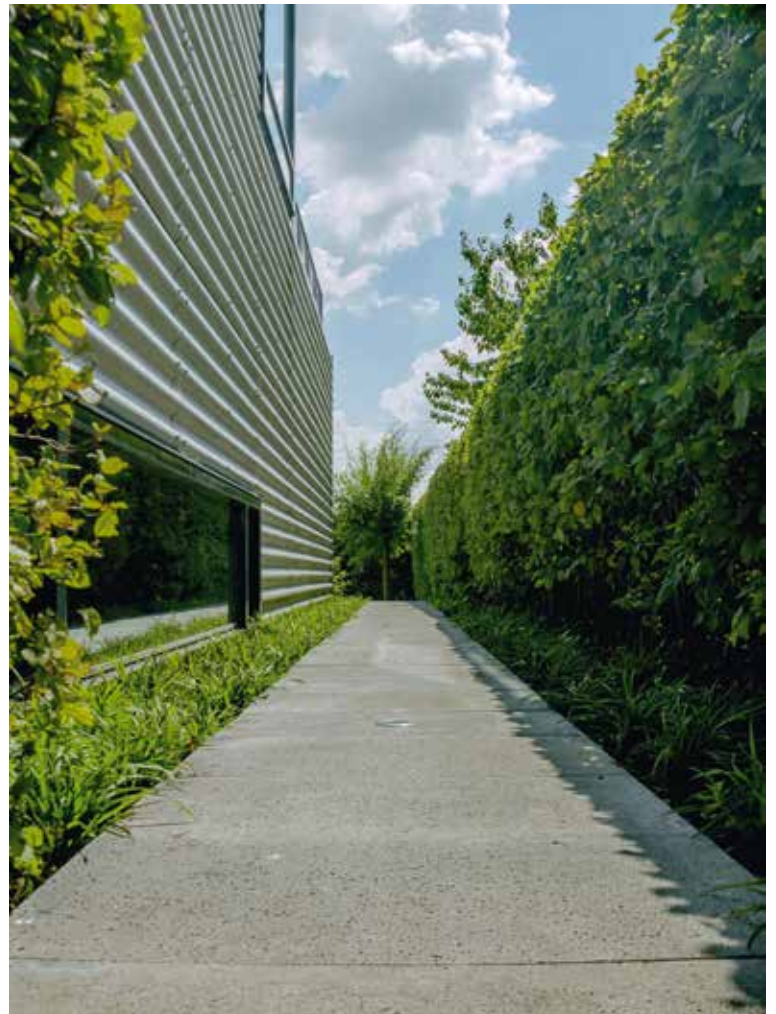
'Een grote binnentuin op een eiland, het Bastion. De Carpinus zuilbomen zorgen voor grote diepte.'