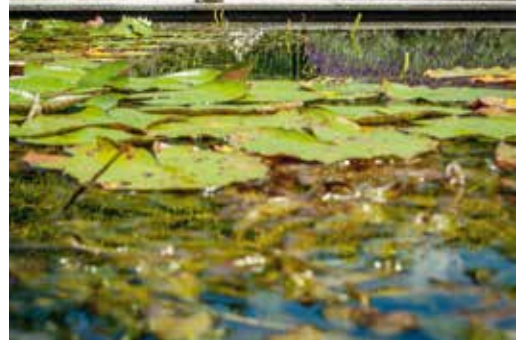
'Deze tuin is verdeeld in verschillende tuinkamers. Het overgrote deel van de tuin bevindt zich op het zuiden, wat de keuze in beplanting erg ruim maakt.'