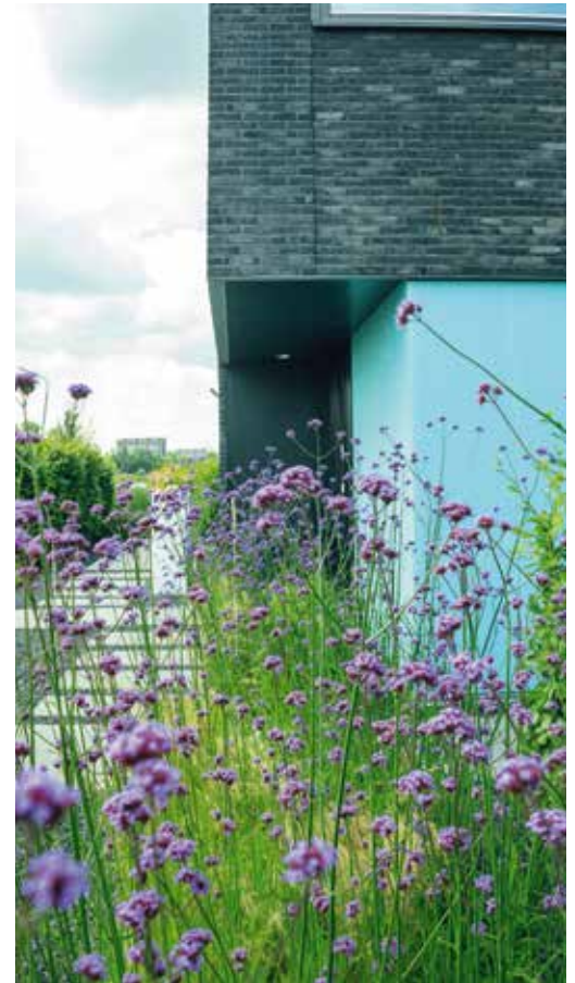
'Deze moderne tuin te Leeuwarden is ongeveer vier jaar oud. Er is in het ontwerp goed gekeken naar de stijl van het huis.'